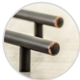
antyczna miedz, antique copper, античная медь, античная медь

Монтажні отвори 352, 384, 416, 480, 512, 544, 576, 608, 640, 672, 704, 736, 768, 800 мм також доступні за індивідуальним замовленням